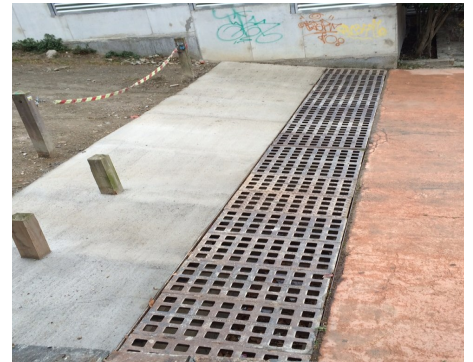
Enllaç amb el tram del dipòsit d'aigües de Collserola amb el carrer Pont.

"Durant el mes de desembre d'enguany i gener de l'any vinent, hi ha prevista la creació d'una illeta d'accés a Can Mèlich per ordenar aquest conflictiu punt."