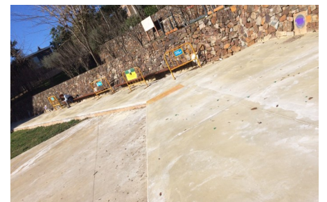
Bancos y tarimado del Parque de la Plana

socios y que nos vienen a reclamar que tienen un bache en el asfaltado, que le han subido el catastro o no funciona su farola... Contad con nosotros, pero por favor, haceros socios y contribuid al bienestar general con vuestra participación. Considerad el mensaje de aquel malogrado presidente: "no pidáis al estado qué puede hacer por vosotros y preguntaros qué podéis hacer por vuestro estado".