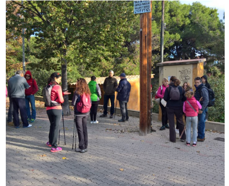
Primer matiners del barri, a punt per a iniciar la pujada a Santa Creu

"La segona edició de la caminada popular del barri supera l'assistència de l'any passat i motiva a realitzar-ne una tercera"