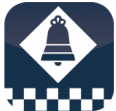
La Policia Local de Sant Just Desvern es una de les impulsores de les novetats en matèria de Seguretat al Baix Llobregat

mail a laplanabellssoleig@gmail.com . Si no es socio hay que hacerse socio simultáneamente.