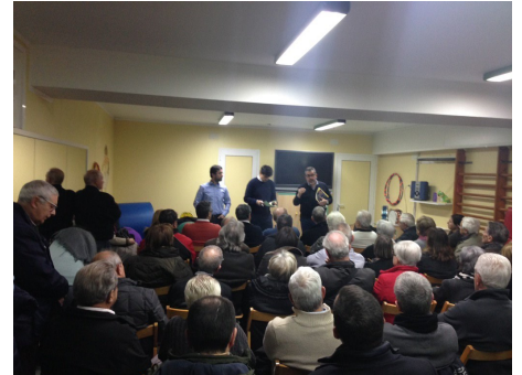
Moment de la xerrada sobre seguretat amb la Policia local i Mossos d'Esquadra

"La policia local i Mossos d'esquadra, van explicar als veïns quines mesures de seguretat poden dur a terme a casa seva per prevenir intrusions"