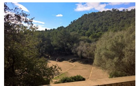
Vista de Santa Creu d'Olorda desde el Restaurant del poblat

Santa Creu d'Olorda. Originalmente, ermita prerrománica, reformada a partir del 1619, la puerta renacentista actual (siglo XVI), la rectoría y las diversas dependencias modificadas a lo largo del tiempo. A pesar de ello, fue quemado el año 1936 y posteriormente restaurado por el grupo excursionista "Els Blaus de Sarrià".