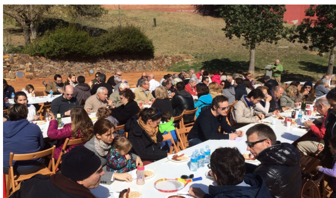
Butifarrada popular al parc de la Plana Padrosa. Març 2016.

L'any 2016 hem seguit la feina iniciada l'any anterior d'augmentar el nombre d'esdeveniments al barri, i novament hem apostat pel format d'un sopar, un dinar i una caminada, que tan bon resultat va donar en la primera edició. Tothom coincideix a assenyalar que aquesta tendència ha de mantenir-se el 2017, ja que això permet als veïns augmentar la comunicació,