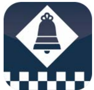
La Policia Local de Sant Just Desvern es una de les impulsores de les novetats en matèria de Seguretat al Baix Llobregat

red de móviles, a la que se accede tras la solicitud de socio a la Asociación y en la uno quedará incorporado previa solicitud por e-mail a laplanabellsoleig@gmail.com