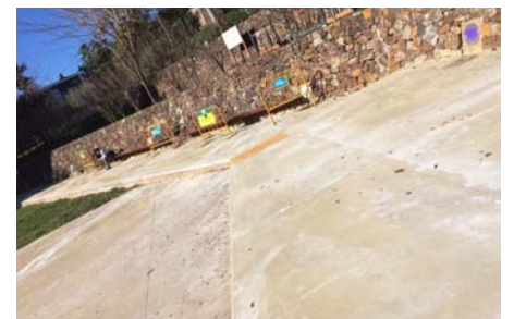
Bancos y tarimado del Parque de la Plana

través de nuestra web www.laplana-bellsolleig.org de estas solicitudes, para que se pueda hacer el seguimiento. Y, aquellos que tengan tiempo y ganas de participar más activamente en una labor al servicio de la colectividad, formando parte de esta Junta que os recibiremos con los brazos abiertos.