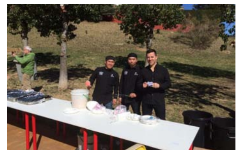
Els cuiners encarregats de cuinar i servir el menjar van tenir molta feina durant tot l'acte.

todos modos, no será necesario esperar tanto tiempo para poder hacer un encuentro entre vecinos. Al mes de junio, como cada año, celebraremos la Noche de Verano.