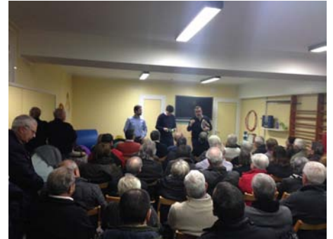
Moment de la xerrada sobre seguretat amb la Policia local i Mossos d'Esquadra

"La policia local i Mossos d'esquadra, van explicar als veïns quines mesures de seguretat poden dur a terme a casa seva per prevenir intrusions"