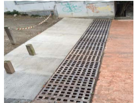
Enllaç amb el tram del dipòsit d'aigües de Collserola amb el carrer Pont.

"Ara mateix, les nostres veuetes sembla que comencen a ser escoltades i s'estan posant al dia certes obres o reparacions històriques"