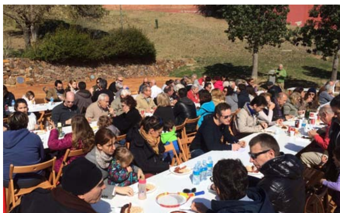
Butifarrada popular al parc de la Plana Padrosa. Març 2016.

Però la força per reclamar per al nostre barri allò que creiem, ve donada ineludiblement per el nombre de socis que siguem. Una Associació que representa a 20 veïns té una força i una