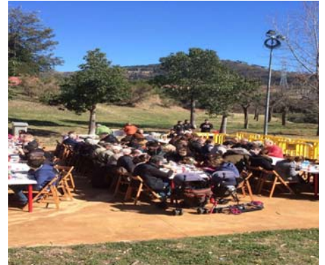
Les taules, a vessar de gent durant la botifarrada.

Donat l'èxit de la convocatòria, en què 90 veïns varen participar, l'Associació preveu repetir-ho de nou el proper any. De tota manera, no caldrà esperar tant de temps per poder fer una trobada popular. Al mes de Juny, com cada any, celebrarem la nit d'Estiu.