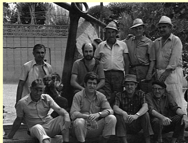
Col·locació de l'àncora, obsequi de l'orfeó Ermes Grion de Monfalcone (Any 1976)